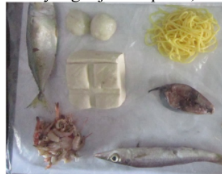
Gambar 1. Bahan makanan

Bahan-bahan yang digunakan dalam penelitian ini yaitu beberapa jenis makanan yang dijual di pasar,