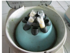
Gambar 2: Proses sentrifugasi bahan makanan

Sampel digerus sampai halus, masing-masing sampel ditimbang sebanyak 5 g lalu dilarutkan dengan ± 50 mL akuades panas (80° C). Selanjutnya larutan dipanaskan selama 30 menit. Larutan tersebut kemudian disentrifugasi dengan kecepatan 3000 rpm selama 20 menit,